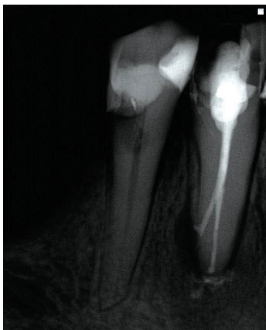
Slika 2. Definitivna opturacija zuba 43 sa dva korenska kanala

vertikalnu perkusiju, ponovljena je interseansna medikacija u trajanju od dve nedelje. Nakon tog perioda zub je bio bez simptoma i kanali su opturirani gutaperka poeinima i silerom (Syntex, Ceramed, Poljska) (Slika 2).