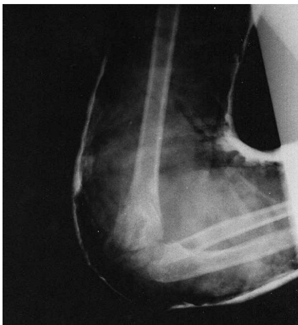
Slika 2. Kontrolna snimka suprakondilarnog preloma tipa III nakon repozicije

Reponirane prelome do povlačenja otoka održavali smo gips longetom koja se plasira od aksile do metakarpo-falangealnih (MCP) zglobova. Nakon toga plasiran je definitivni (cirkularni) gips u trajanju od 3-4 nedjelje. Kontrolne radiografije radili smo petog i dvanestog dana, kao i nakon skidanja gipsa, a prije fizikalne terapije. Po potrebi radiografije su rađene i češće.