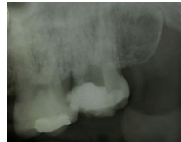
Slika 1. Dijagnostički radiogram zuba 17

Poslije obezbjeđivanja suvog polja rada, operativno područje uključujući i krunicu zuba dezinfikovani su sa 2% hlorheksidinom. Aplik-