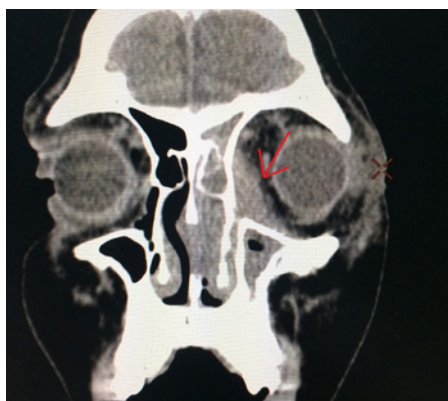
Slika 3a. Kompjuterizovana tomografija paranazalnih sinusa (CT PNS) i orbita sa kontrastom - koronarni presek, levostrani pansinuzitis sa vretenastom promenom veličine 33x9x23mm uz medijalni zid orbite (crvena strelica)