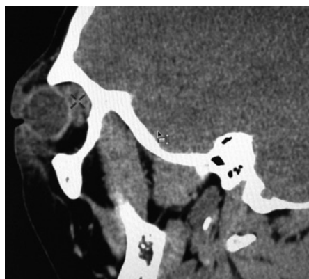
Slika 3b. Kompjuterizovana tomografija paranazalnih sinusa (CT PNS) i orbita sa kontrastom - mediasagitalni presek leve orbite, crvenim crticama označena inflamirana heterogena kolekcija (apsces)