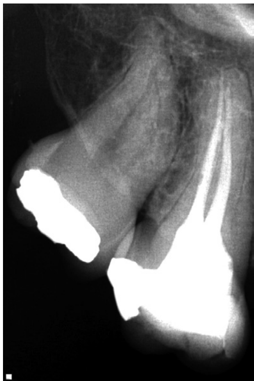
Slika 3. Definitivna opturacija zuba 17 sa dva korenska kanala

menta kanali su irigirani sa po 2 ml 1% rastvora NaOCl (Semikem, Sarajevo, BiH), a nakon završene celokupne hemomehaničke obrade, finalno irigirani sa 2 ml 17% rastvora EDTA (Pulpdent EDTA Solution; Pulpdent, Watertown, MA) u trajanju od dva minuta i posušeni sterilnim papirnim poenima (Dentsply Maillefer, Ballaigues, Švajcarska). Nakon toga, određeni su glavni gutaperka poeni i kanali su opturirani pastom Syntex (Syntex, Ceramed, Poljska) koristeći modifikovanu monokonu tehniku (Slika 3). S obzirom da kod pacijenta nije bila prisutna postoperativna osetljivost nakon endodontskog tretmana, upućen je na odeljenje Stomatološke protetike, Medicinskog fakulteta u Foči, kako bi se pristupilo izradi fiksne protetske nadoknade u gornjoj vilici.