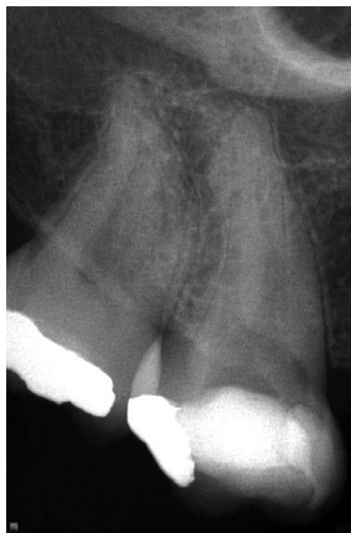
Slika 1. Dijagnostički radiogram zuba 17

Nakon ispitivanja inicijalne prohodnosti K turpijom # 10 (Dentsply Maillefer, Ballaigues, Švajcarska), uz pomoć apeks lokatora (Raypex